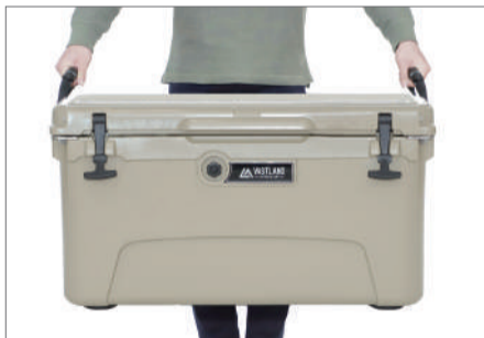
33.1L / 42.5L / 70.9Lの場合